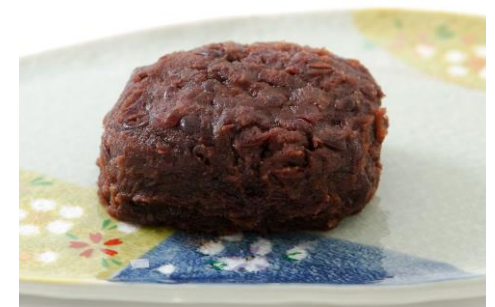
無料写真素材「花ざかりの森」