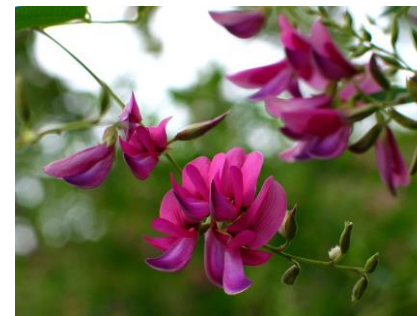
神戸観光壁紙写真集

・花札でも7月の札として猪と一緒に描かれています。これは臥猪の床(ふすいのとこ)と呼ばれ、猪のような荒々しい動物が萩などの、か細く美しい植物を倒して寝床としている様子が美しい対比とされてきました。